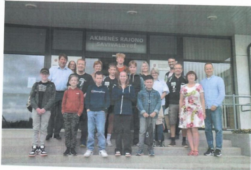
2 nuotr: Svečių iš Norvegijos delegacija lankėsi Akmenės rajono savivaldybėje

2023 metų rugpjūčio 9-12 dienomis Akmenės rajono stalo teniso klubo „Mažoji raketė“ kvietimu į Akmenės kraštą atvyko stalo teniso klubo Hardanger BTK 12 svečių delegacija iš Norhensund miestelio Norvegijoje.