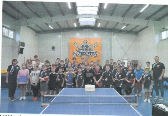
1 nuotr: XXVIII-ojo Akmenės rajono stalo teniso klubo „Mažoji raketė“ gimtadienio turnyro jaunieji dalyviai

2023 m. spalio 28-29 dienomis vyko XXVIII-ojo Akmenės rajono stalo teniso klubo „Mažoji raketė“ gimtadienio turnyrai.